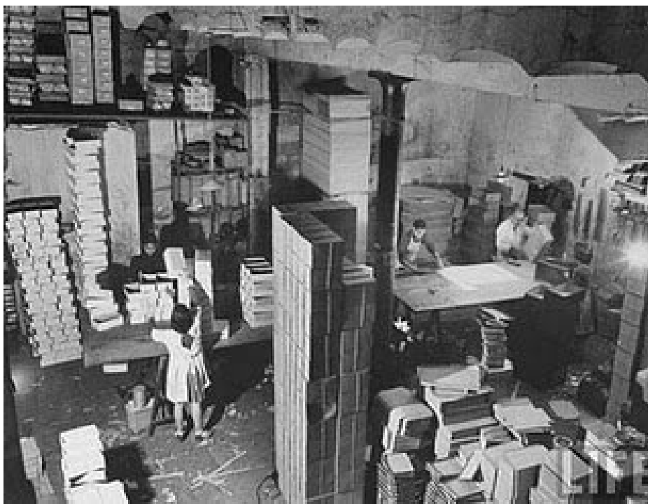
Fotos de Montevideo en 1941, publicadas en la revista LIFE - Reportaje fotográfico de la ciudad de Montevideo realizado por fotógrafo Hart Preston para la revista LIFE en 1941. Preston estuvo varios meses radicado en el país. -