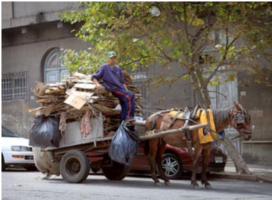
Secretaría de Salud Laboral y Medio Ambiente