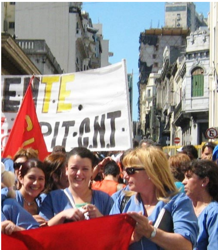
Equipo Técnico del Instituto Cuesta Duarte PIT CNT

Sin embargo, algunos datos siguen siendo preocupantes. Las mujeres jóvenes siguen soportando tasas de desempleo superiores a las observadas para el promedio de la economía y en particular en relación a los hombres jóvenes: en diciembre de 2010, la tasa de desempleo de mujeres jóvenes se ubicaba en datos por encima del 25%. No puede desconocerse este problema y mucho menos en un contexto de fuerte crecimiento económico y mejora de los indicadores generales del mercado de trabajo. Aún hoy, ser mujer joven es un problema en nuestro país. La implementación de