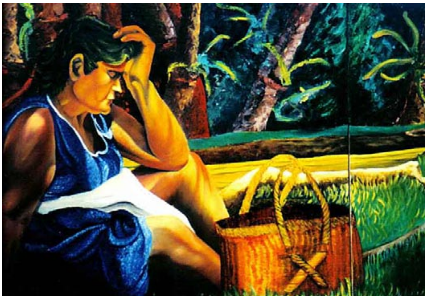
Adolfo Payes (**)

Reconociendo en particular la importante y valiosa labor de Monseñor Óscar Arnulfo Romero, de El Salvador, quien se consagró activamente a la promoción y protección de los derechos humanos en su país, labor que fue reconocida internacionalmente a través de sus mensajes, en los que denunció violaciones de los derechos humanos de las poblaciones más vulnerables;