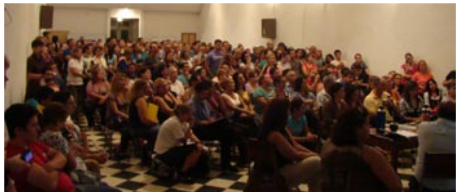
Reunión del PVS en el Plenario de Rivera

pación de un pequeño grupo de sindicatos, pero poco a poco se han integrando en estos meses la mayoría de los sindicatos. Al mismo tiempo se han ido conformando cooperativas y se ha logrado una