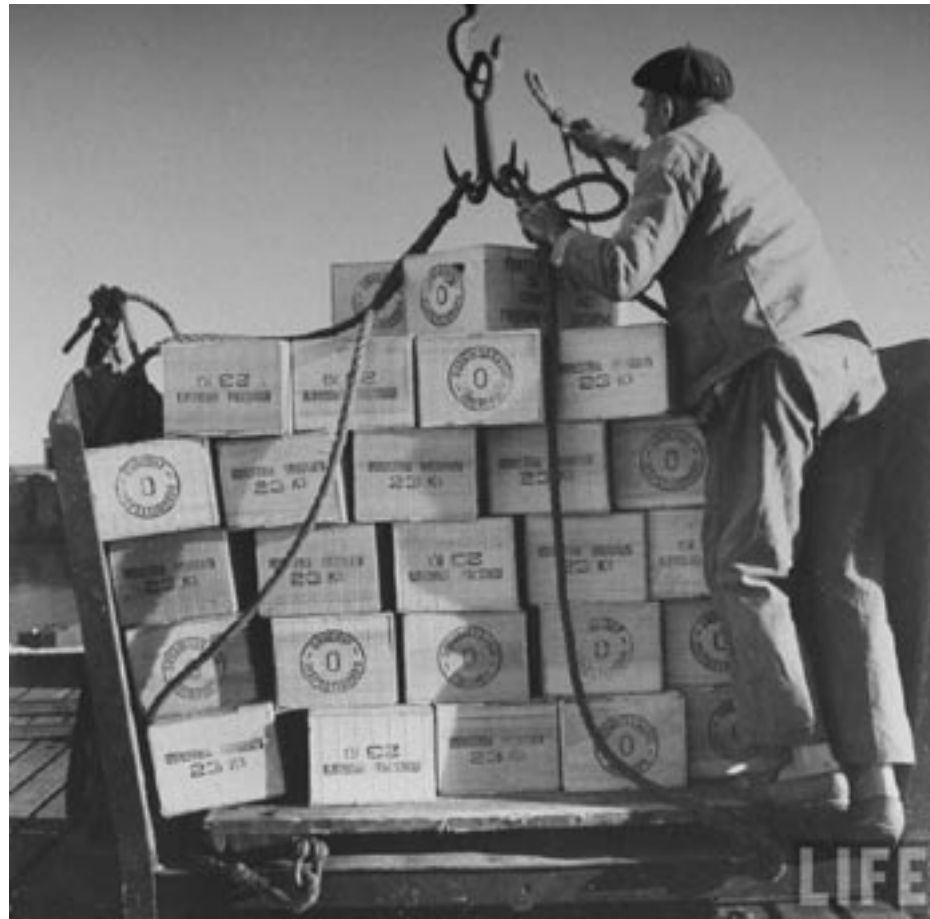
Mag. Rodolfo Porrini

Si bien existió un ambiente político propicio para un regreso al “modelo agro-exportador”, esto no ocurrió. Contando con un proceso de acumulación previo, se dieron condiciones internas y externas para el desarrollo de una industria liviana en el país, creciendo el sector