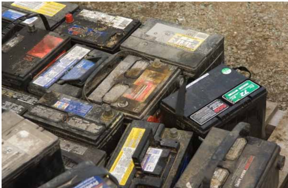
Secretaría de Salud Laboral y Medio Ambiente del PIT CNT

A esto se agrega que no hay hasta el momento vertederos industriales de residuos peligrosos y especiales. Ya hace unos años que la Inten-