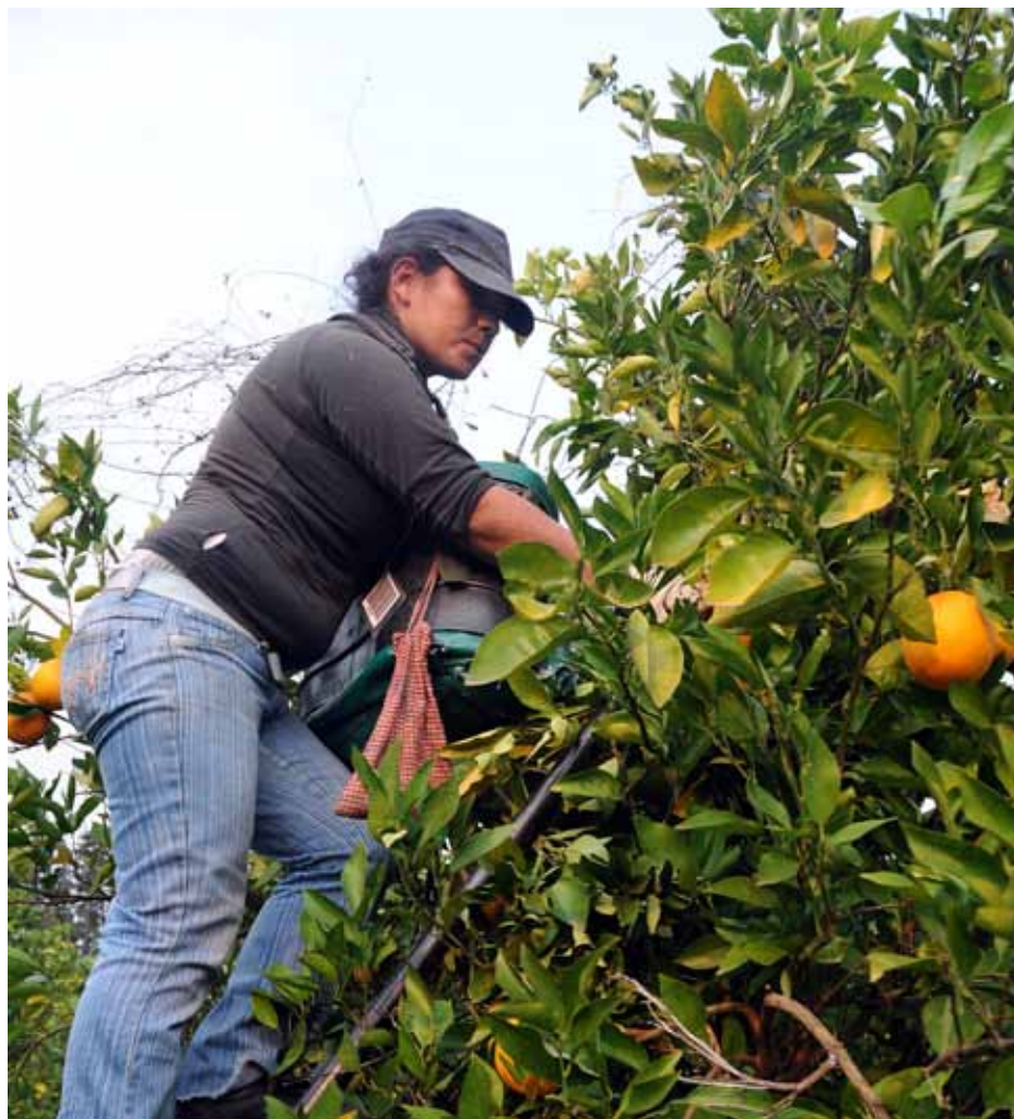
Equipo de Investigación - Instituto Cuesta Duarte PIT CNT

El análisis de la demanda de trabajo se realiza a partir de la evolución de la tasa de empleo , que mide la proporción que representan el total de ocupados entre el total de personas de 14 años o más. Acompañando la fuerte expansión económica, en los últimos años Uruguay ha venido registrando cifras récord