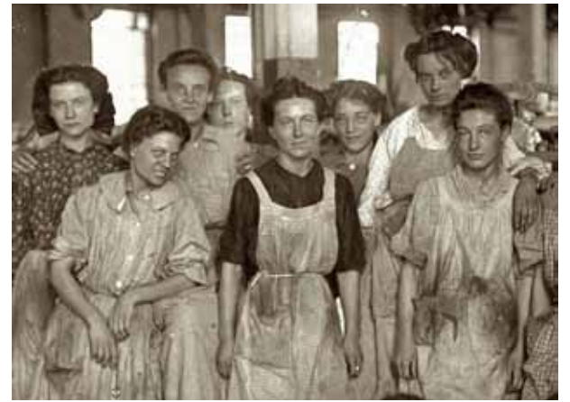
“SIGLO XXI: LAS MUJERES SEGUIMOS LUCHANDO POR NUESTROS DERECHOS”