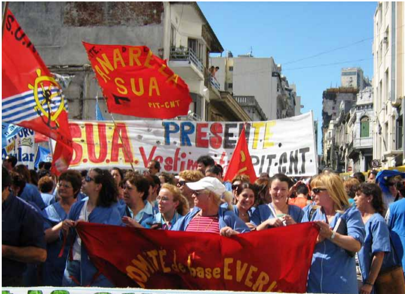
Secretaría-Departamento de Género, Equidad y Diversidad

Las mujeres enfrentamos la dictadura en las primeras líneas en la Huelga General, muchas de nosotras fuimos torturadas, muertas y desaparecidas... Aun seguimos buscando a nuestros hijos.