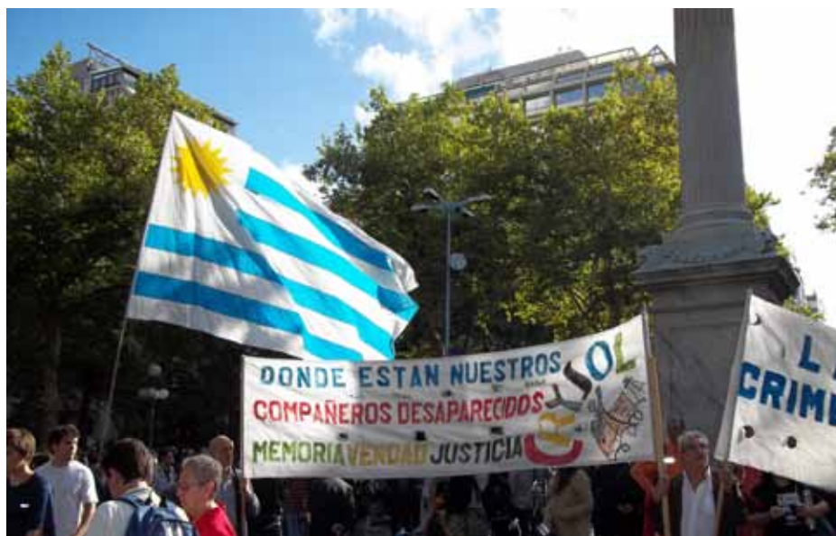
Movilización convocada por el PIT CNT, Frente Amplio, Madres y Familiares, Crysol, Fucvam, FEUU, Onajpu y otras organizaciones en rechazo de la declaración de inconstitucionalidad por parte de la Suprema Corte de Justicia, referida a la ley interpretativa de la ley de Caducidad- Plaza Libertad, 25 de febrero.

la ley que llamaron "de caducidad de la pretensión punitiva del Estado" , antaño; que en buen romance proclamó que el Estado renunciaba a perseguir a los criminales que actuaron impunemente durante la dictadura cívico-militar. Usted aprecia esto claramente ¿verdad? El Poder Ejecutivo y el Parlamento de la época dijeron que el estado uruguayo no iba a cumplir con su deber de perseguir el delito, en algunos casos.