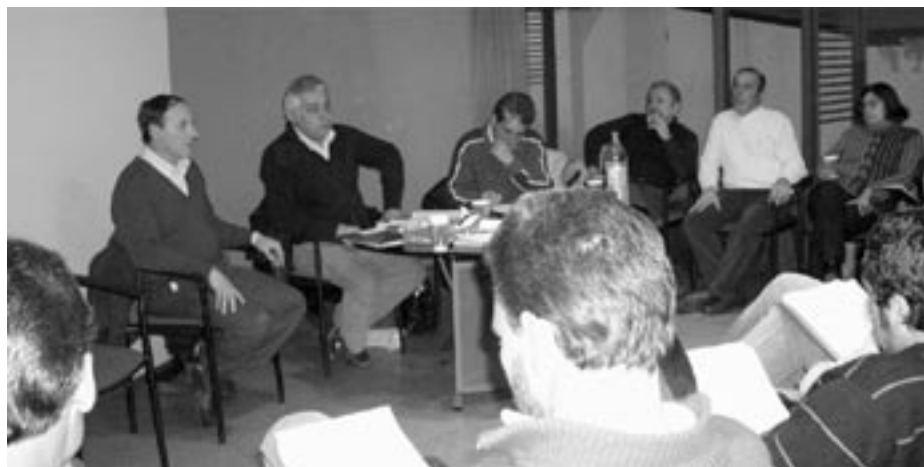
Representación de los trabajadores en la JUNAE

Los temas abordados son aquellos que guardan directa relación con la generación de políticas activas de empleo a nivel departamental, enfocado desde la perspectiva del desarrollo económico local . Algunos de los puntos que se están