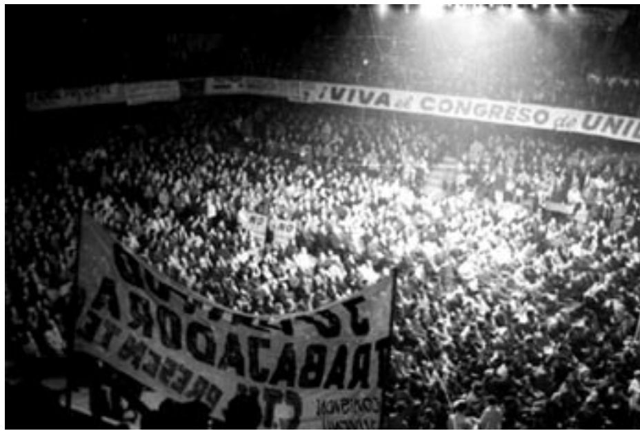
l Congreso del Pueblo 1965 – Palacio Peñarol

• Ese Plan Agrario Nacional bragará por la conservación de la tierra en su rendimiento apto natural, por la soberanía alimentaria, por la preservación de los recursos naturales (agua, flora, fauna, subsuelo, aire, establecimientos humanos), priorizando toda la producción alimentaria agrícola-ganadera, de huerta, de chacra y de granja, (ganadería ovina, porcina, bovina, equina), la cunicultura, la apicultura, la producción hortícola y frutal, los productos no tradicionales, la producción de praderas y de bosques, de floricultura. Todas estas formas de producción estarán sujetas al Plan Agrario Nacional que jerarquice por sobre todas las cosas el bienestar de todos los uruguayos y uruguayas, y atienda las condiciones del mercado regional, continental y mundial. Se alentará el repoblamiento de la campaña a través del Instituto Nacional de Colonización, las cooperativas productivas agrarias y otras formas de organización de los trabajadores de la tierra, a quienes se facilitarán tierras, créditos, herramientas, asesoría técnica, animales, semillas e insumos. El P.A.N. incorporará a los mercados agrícolas, los feriantes, los transportistas y todo aquel sector directa o indirectamente relacionado con los productos