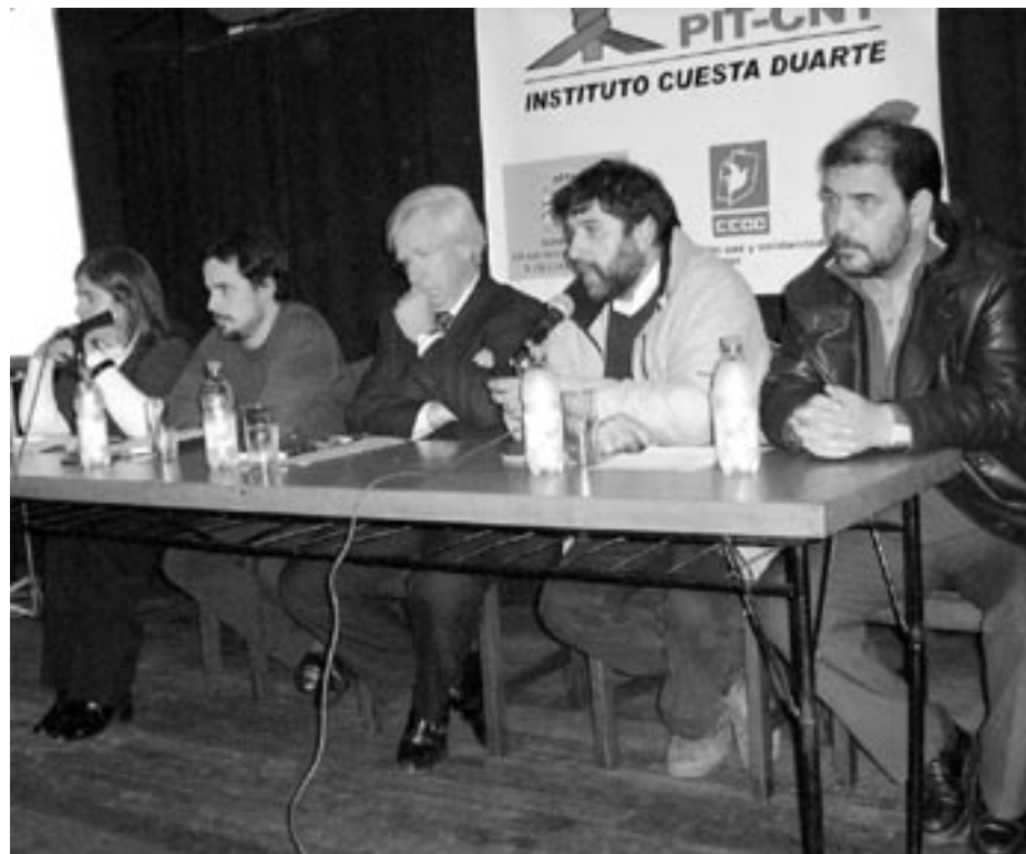
Equipo de Investigación del Instituto Cuesta Duarte PIT CNT

El escenario de presiones inflacionarias externas es caldo de cultivo para que productores, intermediarios