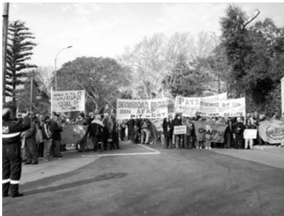
Equipo en Representación de los Trabajadores en el BPS

En apretada síntesis vamos a relatar los principales aspectos del mismo. Primero realizamos una reseña de lo que ha sido la posición de denuncia del movimiento sindical del sistema de seguridad social implantado en nuestro país luego de la aprobación de la ley 16.713, y recordamos que los trabajadores planteamos que es preciso tomar decisiones que transcurran por el camino de modificar el sistema, para establecer uno que se ajuste a las necesidades de las personas, que cubra las contingencias que aquejan a la gente y que aplique los principios de solidaridad, redistribución de la riqueza, universalidad de la cobertura, participación de los interesados, y que ello se lleve adelante mediante organizaciones sin fines de lucro, donde el Estado asuma el rol que le compete en la determinación de las políticas de seguridad social.