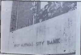
La banque nationale est chaque jour plus «Nationale».

La crise du système capitaliste, la crise du pétrole, la chute des prix de la viande, les exigences des crédettes obligaient les putschistes à regrouper leurs forces dans le pays en appui à la dictature et à adopter une politique économique qui résoudrait les graves difficultés de l'économie. Vient alors l'heure de Vegh Villegas pour assumer le poste de ministre de l'économie. Sans changer la formulation officielle de la politique économique (ouverture de l'économie, libéralisation, lutte contre l'inflation, etc.etc.) on utilisera les instruments économiques (type d'échange, intérêts, inflation, etc.) pour donner aux secteurs clés pour le fonctionnement du modèle des niveaux de salaire adéquats et châtier les autres.