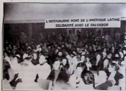
Partie du public débordant la salle «Eugène Enaff» dans le centre de Paris le vendredi 6 Février.

La manifestation s'est terminée par une représentation d'un groupe folklorique chilien et par le film « El Salvador, le peuple vaincra ».