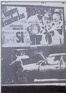
Publicity in favour of a 'yes' vote.

The dictatorship wants to acquire an agreement of the I.L.O., its green light for a proposal of a law violating totally the Conventions No. 87 and 98 of the I.L.O., its Constitution as well as the laws and constitution of the Republic; clauses and stipulation contained in this draft-proposal can be found also in the draft-proposal of the Constitution rejected by the people on November 30, last year. Nowadays, the dictatorship is trying to drown this pronouncement, this expression of the people's will, by adopting in the State Council what the people had