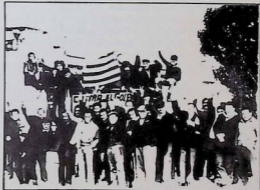
Un aspect de la résistance pendant l'héroïque grève générale.

De même que la grève générale n'a pas été une explosion spontanée, mais l'application des résolutions de la C.N.T., le 30 novembre n'a pas été une action spontanée et explosive d'un peuple désorienté et désillusionné, mais l'action consciente d'un peuple qui sait ce qu'il veut et qui a construit pierre par pierre le grand édifice de l'unité antifasciste.