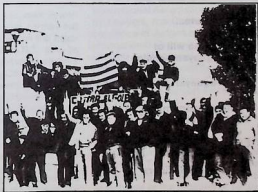
One aspect of the resistance during the heroic general strike.