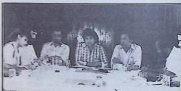
Conférence de presse à l'Hôtel Caribe à Panama effectuée pour les camarades de la Régionale Amérique.

- Ils ont eu un entretien avec trois membres du Comité Exécutif de la Centrale Nationale des Travailleurs du Panama (CNTP-CPUSTAL).