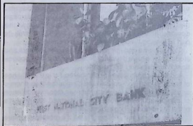
The National Bank becomes each day more «national».

The restructuring of the state administration and machinery while maintaining and developing its role in the economy -in spite of some minor concessions to the private sector- stimulated the «non traditional» export industry, developed financial activity -with the attempt to create in Uruguay a strong financial centre- even where the possibilities are limited- transferred the incomes from the agricultural sector, especially from the workers, to privileged sectors, determined the types and ways of exchanges, used foreign credits to cover the fiscal deficit, modified the interest rates with the intention to reconstruct the credit system of the country, determined an inflation rate with the objective to guarantee adequate profit margins for the capital and income transfers. The