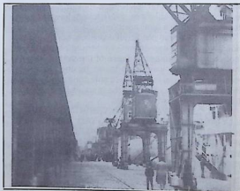
View of the port of Montevideo

The crisis of the capitalist system, the oil crisis, the drop in meat prices, the demands of the creditors obliged the coup plotters to regroup their forces in the country, strengthen their dictatorship and adopt an economic policy which could solve the grave difficulties of the economy. The time came for Vegg Villegas to take the post of the minister of economy and finances and to introduce a new economic model. Without changing the official formulation and wording of the economic policy -open economy, liberalisation, struggle against inflation, etc- such economic instruments are used -way of exchanges, interest rates, inflation, etc- to provide adequate wage levels for key sectors decisive of the model function, while punishing the remaining ones.