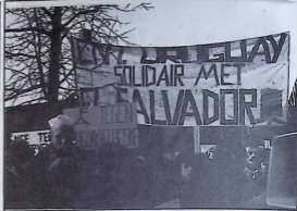
Solidarité de la colonie uruguayenne, portant des pancartes expressives manifestant sous le drapeau de la C.N.T. et du Frente Amplio.