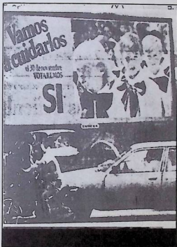
Affiche en faveur du SI dans les rues de Montevideo

La dictature cherche à obtenir le consentement de l'O.I.T., le feu vert pour le projet de loi qui est une violation des Conventions Nos. 87 et 98 de cette organisation, de la Constitution de l'O.I.T., des lois et de la Constitution de la République; des dispositions contenues dans ce projet de loi figurent également dans le projet de Constitution rejeté par le peuple de 30 novembre dernier. A présent, la dictature prétend «noyer» ce prononciamiento en adoptant au Conseil d'Etat ce que le peuple a refusé au scrutin.