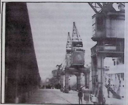
Aspect du port de Montévideo.

La restructuration de l'appareil d'Etat, tout en conservant et développant son rôle dans l'économie nationale (malgré une certaine privatisation et des concessions au secteur privé) a stimulé l'industrie d'exportation «non traditionnelle», développé l'activité financière (tendant à créer en Uruguay une place forte financière où les possibilités sont limitées), transféré les revenus du secteur agricole, en particulier des travailleurs, vers les secteurs favorisés, déterminé le type d'échange, utilisé des crédits extérieurs pour couvrir le déficit fiscal, modifié les taux d'intérêt pour reconstruire le système de crédit du pays, déterminé les taux d'inflation pour garantir un taux adéquat de profits au capital et au transfert des revenus. Les mesures ont été adaptées aux exigences. Le décret du 23 août 1978, salué par les éleveurs, a été en un certain sens anodin car la définition du type d'échange à partir du décret d'octobre 1978 (pré-avis de six mois concernant le type d'échange) combiné à un taux d'intérêt élevé et à d'autres mesures monétaires a annulé dans une grande mesure les avantages attendus par les éleveurs et facilité en définitive les profits de l'industrie des frigorifiques, des investisseurs étrangers tant de capitaux de spéculation comme celle destinée aux propriétés immobilières.